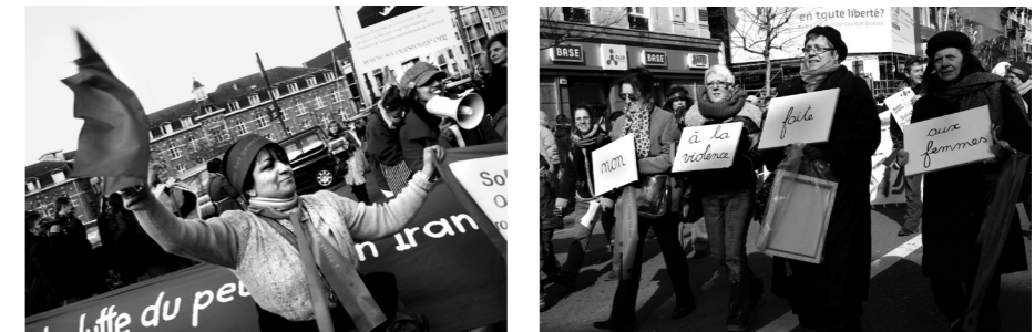
Manifestation de la Marche Mondiale des femmes à Bruxelles © Claire Malen, 2010

Bien entendu l'idée de l'unité reste primordiale, il n'est pas question ici de séparer les femmes de leurs luttes ou de les hiérarchiser ; il s'agit de montrer la diversité dans l'unité et de mettre en perspective le collectif et l'individuel.