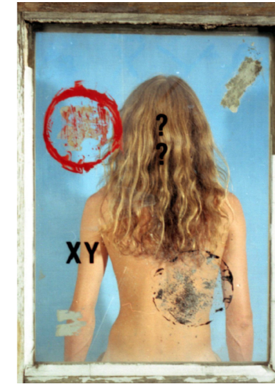
© Claire Malen, YX, questions de genre , 2004