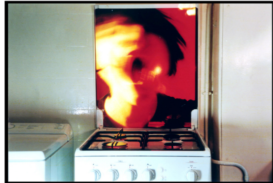
série Les lieux de l'hystérie, 2007-2008