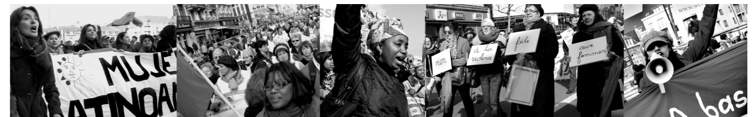
La Marche Mondiale des femmes, Bruxelles

L'exposition pourra être mise en place à partir de février 2011.