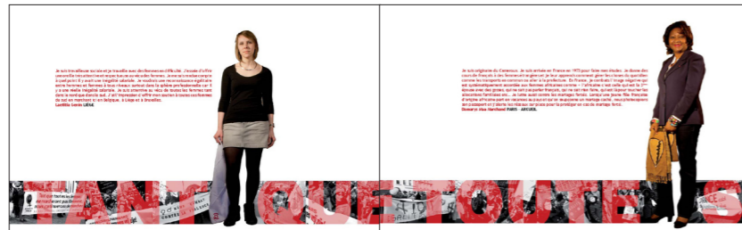
Aperçu de la maquette du livre ouvert en double page

La dimension du livre est de 16X26 cm fermé et 16X130 cm déplié. Il se compose de 40 pages sur papier 320 g. Le livre est présenté en même temps que l'exposition.