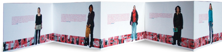
Aperçu du livre déployé en léporello (longueur 1,30 m)

Les témoignages des militantes sont retranscrits à côté de leur portrait. Il y a un portrait par page.